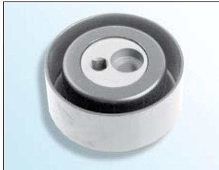
Fot. 1: pierścień toczny z metalu

W ramach ciągłego rozwoju naszych produktów zmieniono materiał pierścienia tocznego napinacza 531 0148 10 z metalu na tworzywo sztuczne.